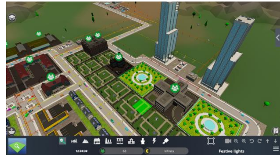
Εικόνα 3. Η πόλη περιλαμβάνει περαιτέρω μικρές και μεγάλες κατοικίες για τους κατοίκους καθώς και πάρκα.

Το σενάριο έχει μια σκόπιμα υψηλού επιπέδου άποψη του σχεδιασμού της πόλης. Έχει σχεδιαστεί ως εισαγωγική δραστηριότητα στο παιχνίδι μάθησης HERA. Είναι αυτόνομο και δεν απαιτεί εξειδικευμένες γνώσεις από τους μαθητές. Οι μαθητές πρέπει απλώς να κατανοήσουν τη βασική λειτουργικότητα του παιχνιδιού HERA όσον αφορά την ανάπτυξη υποδομών και υπηρεσιών.