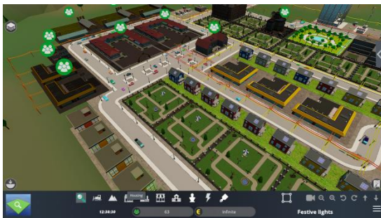
Εικόνα 4. Η πόλη περιλαμβάνει περαιτέρω μικρομεσαίες επιχειρήσεις για την υποστήριξη της οικονομικής δραστηριότητας.

Ανάλογα με τον ρόλο τους, οι μαθητές πρέπει να αποφασίσουν για το τι διακοσμητικά να εγκαταστήσουν, πού και πότε. Το παιχνίδι περιλαμβάνει τους ακόλουθους ρόλους: