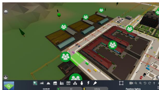
Εικόνα 5. Η πόλη περιλαμβάνει επίσης αγροκτήματα που παράγουν προϊόντα για τους κατοίκους.

Οι ιδιοκτήτες επιχειρήσεων μπορούν να αποφασίσουν τον βαθμό στον οποίο θα επενδύσουν σε εορταστικές διακοσμήσεις στο πλαίσιο της εκστρατείας ανάπτυξης της επιχείρησής τους. Θα πρέπει να λάβουν υπόψη πολλές μεταβλητές για να διευκολύνουν τη λήψη αποφάσεων. Για παράδειγμα, εάν αποφασίσουν να ξοδέψουν ένα μεγάλο ποσό για εορταστικές διακοσμήσεις, αλλά ο δήμαρχος δεν προτείνει μια ελκυστική προσφορά, μπορεί να καταλήξουν με μικρότερο κέρδος στο τέλος των διακοπών. Από την άλλη πλευρά, εάν ο δήμαρχος της πόλης αποφασίσει να εφαρμόσει πλούσιους εορτασμούς, αλλά δεν επενδύσει αρκετά στην επιχείρησή του, θα χάσει την ευκαιρία να επωφεληθεί από την πρωτοβουλία του δημάρχου. Τελικά, εάν δεν έχουν κέρδη, δεν θα μπορούν να πληρώσουν περισσότερους φόρους και ο προϋπολογισμός της πόλης μπορεί να υποφέρει. Από πιο πρακτική άποψη, οι μαθητές θα επιλέξουν από μια ομάδα διακοσμητικών που προσφέρει το παιχνίδι για να εγκατασταθούν στα καταστήματα, τα εστιατόρια ή άλλες επιχειρήσεις τους.