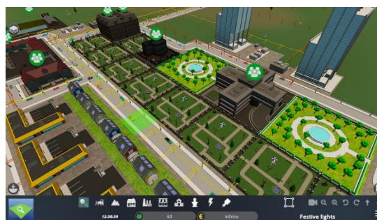
Εικόνα 1. Σε αυτή τη δραστηριότητα, οι μαθητές θα αναπτύξουν εορταστικές διακοσμήσεις σε μια πόλη για διακοπές στο τέλος του έτους.

Κατά τη διάρκεια των διακοπών στο τέλος του έτους, οι άνθρωποι γιορτάζουν, βρίσκονται μαζί με την οικογένεια και τους φίλους τους, ταξιδεύουν και ακολουθούν τις παραδόσεις. Ως αποτέλεσμα, θεωρούνται ως ένα βασικό γεγονός σε πολλές πόλεις που σχετίζεται τόσο με την ευτυχία των πολιτών τους όσο και με τις ευκαιρίες για επιχειρήσεις και ανάπτυξη πόλεων. Για να υπογραμμιστεί περαιτέρω, οι πόλεις που εορτάζουν, προσθέτουν εορταστικά φώτα και διακοσμήσεις σε κεντρικές πλατείες, τοποθεσίες πολιτιστικού ενδιαφέροντος, εμπορικές περιοχές και πολλά άλλα.