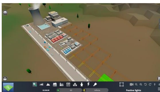
Εικόνα 2. Η πόλη περιλαμβάνει υποδομές όπως η ενέργεια, το διαδίκτυο και οι τηλεφωνικές υπηρεσίες που μπορούν να εμπλουτίσουν οι μαθητές.

Ο δήμαρχος της πόλης αποφασίζει για τις υπηρεσίες που προσφέρει η πόλη στους πολίτες της. Ο δήμαρχος μπορεί να δημιουργήσει δημόσιες υπηρεσίες, όπως νοσοκομεία, μουσεία, εκπαιδευτικούς οργανισμούς και υποδομές όπως δρόμοι, διαδίκτυο και τηλεφωνικά δίκτυα που αυξάνουν την ποιότητα ζωής σε μια πόλη.