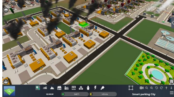
Figura 4. Las industrias consumen energía, que se produciría mejor a través de recursos renovables.

Los participantes pueden explorar las consecuencias de sus decisiones y comprender lo que significa en la vida real trabajar con decisiones complejas. El escenario se basa en una cuadrícula de la ciudad que no es trivial, que incluye instalaciones lo suficientemente ricas para que los estudiantes participen de manera significativa en una discusión compleja relacionada con el tema de la energía. La red de la ciudad inicial, en la que los estudiantes comenzarán a trabajar, tiene un enfoque energético tradicional centrado en los combustibles fósiles que generan contaminación. Los estudiantes tienen el desafío de introducir intervenciones para la producción de energía limpia. Como dificultad adicional, la ciudad puede tener eventos climáticos que eleven la demanda energética, creando picos.