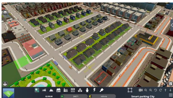
Figura 3. Los edificios residenciales pequeños y grandes satisfacen las necesidades de los habitantes de la ciudad.

El propósito general del escenario es permitir que los estudiantes experimenten los conflictos de intereses y la dificultad de implementar cambios cuando un aspecto importante de la ciudad, como la energía, tiene que ser reconfigurado dramáticamente con implicaciones en la infraestructura pero también en la forma de pensar individual sobre el acceso a la energía. Exige buenas habilidades de colaboración, compromisos para lograr objetivos comunes en un equipo, pensamiento crítico y buen gusto para optimizar las decisiones.