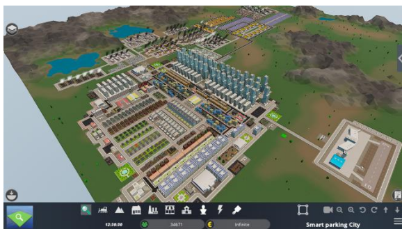
Figura 1. Una gran red urbana permite a los jugadores experimentar con soluciones de energía renovable.

Las ciudades dependen de la distribución de energía para poder proporcionar condiciones de asentamiento y desarrollo para las personas, industrias, servicios, etc. La distribución de energía normalmente está asegurada por operadores privados o públicos fuera del alcance o control de la ciudad. Sin embargo, dado que las ciudades pueden convertirse en centros de contaminación debido a la producción, incluso si esta tiene lugar fuera de los límites de la ciudad, y el uso de esa energía es de interés para los habitantes de la ciudad garantizar que la producción de energía sea lo más limpia posible. Los administradores de la ciudad también pueden implementar políticas y regulaciones que contribuyan a la producción local de energía limpia, como promover el uso de paneles solares en los techos, centrales microeólicas y otras tecnologías. También los gestores de las ciudades pueden introducir políticas que fomenten la movilidad basada en energías limpias, reduciendo así el nivel de contaminación. El objetivo principal de este plan de lecciones es animar a los estudiantes a diseñar un suministro de energía para la ciudad basado principalmente en energías renovables.